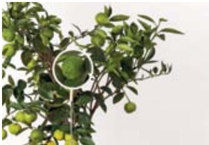
Dida ita Dida ing