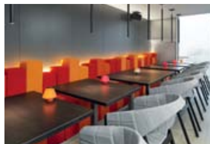
Dida ita Dida ing

Il carattere eterogeneo delle esperienze lavorative svolte da Albert Schrurs, prima di aprire il proprio studio nel 2011, connota i progetti realizzati, spaziando dalla moda all'architettura, dal design degli interni al complemento d'arredo. Schrurs ha un portfolio molto ricco in cui si percepisce la sua maturità progettuale nella capacità di interpretare il contesto e trovare la soluzione più adatta senza perdere la propria identità. Per il SaloneSatellite presenta una collezione di prodotti per le diverse stanze della casa: il bagno, la camera da letto e l'ingresso.