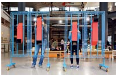
Dida ita Dida ing

A volte progettare può anche voler dire creare uno stimolo per riflettere sulle nostre abitudini, sugli stili di vita o semplicemente sul mondo che ci circonda. I progetti realizzati da Livia Rossi e Gianluca Giabardo sono riflessivi, nel senso che invitano l'utente finale a guardare il mondo con occhi diversi. Nel caso di Quattrocchi è un gioco che stupisce i più piccoli, mentre il nuovo prodotto che presentano al SaloneSatellite permette di curare e osservare le piante che abitano le nostre case.